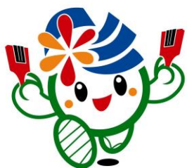
彩夏祭シンボルキャラクター 「彩夏ちゃん」